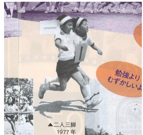
〈高陵小学校PTA広報誌〉

2学期がスタートしました。先のことは、まだまだ見えないかもしれませんが、全力で突き進んでください。何事も「きっとできる」と信じて頑張りましょう。